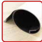
丸めてコンパクト収納