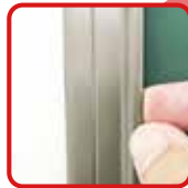
簡単に貼ってはがして ワンタッチイージーバー