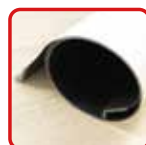
丸めてコンパクト収納