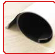
丸めてコンパクト収納