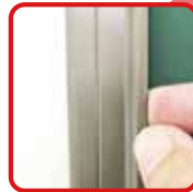
簡単に貼ってはがして ワンタッチイージーバー