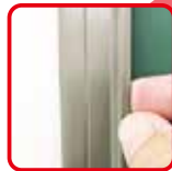
簡単に貼ってはがして ワンタッチイージーバー