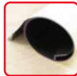
丸めてコンパクト収納