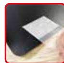
透明タブを裏面に貼ってください。