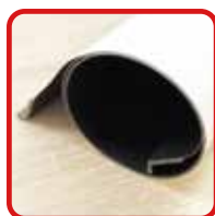
丸めてコンパクト収納