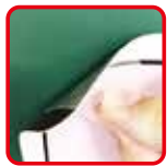
透明タブで剥がしやすい!