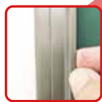
簡単に貼ってはがして ワンタッチイージーバー