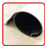
丸めてコンパクト収納