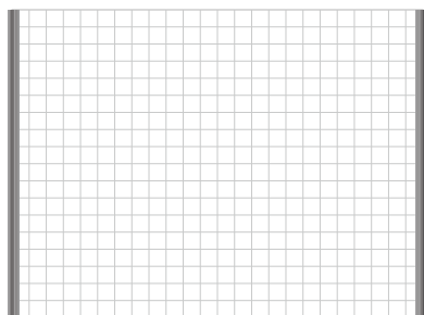
プロジェクタースクリーンホワイトマグネット9012