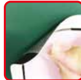
透明タブで剥がしやすい！