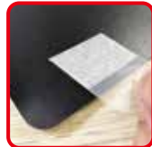
透明タブを裏面に貼ってください。