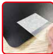
透明タブを裏面に貼ってください。