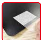
透明タブを裏面に貼ってください。